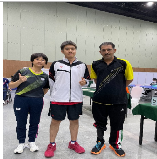
10 級男子雙打與科威特聯隊