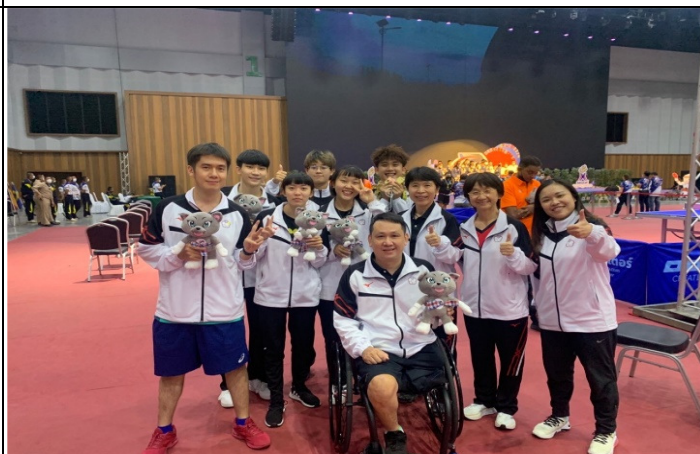
各項單打賽獲獎人員