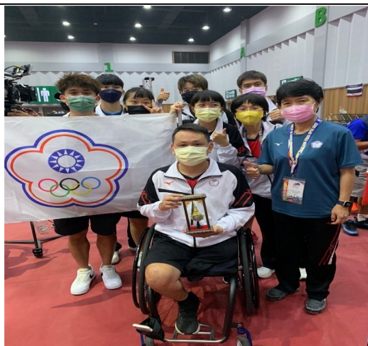
參加開幕與主辦單位獲贈紀念品